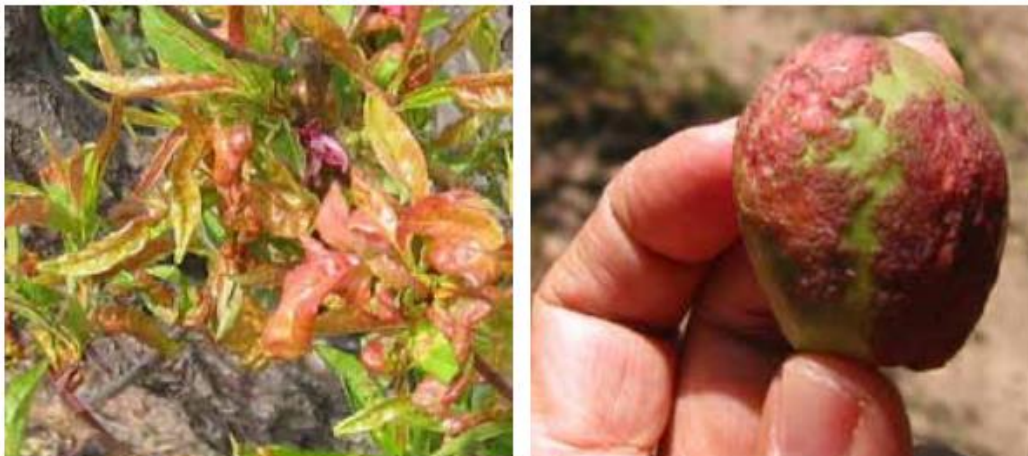
Figura 4 Daño en hojas (izquierda) y frutos (derecha) por el hongo Taphrina deformans .