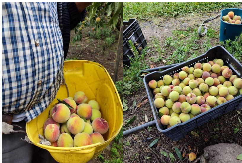
Figura 2 Cultivo de durazno y frutos del Municipio de Chitagá, Norte de Santander