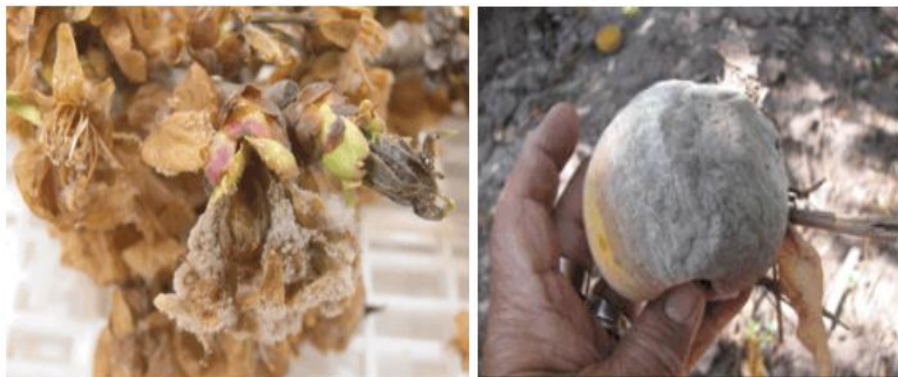
Figura 3 Flor con Monilia (izquierda) y fruto dañado por Monilia (derecha).

La podredumbre se clasifica en dos: podredumbre morena y podredumbre blanda. En Uruguay la podredumbre morena es la enfermedad fúngica que más afecta los cultivos de durazno. Esta enfermedad es causada por tres especies del género Monilinia ( Monilinia fructicola , Monilinia laxa y Monilinia fructigena ).