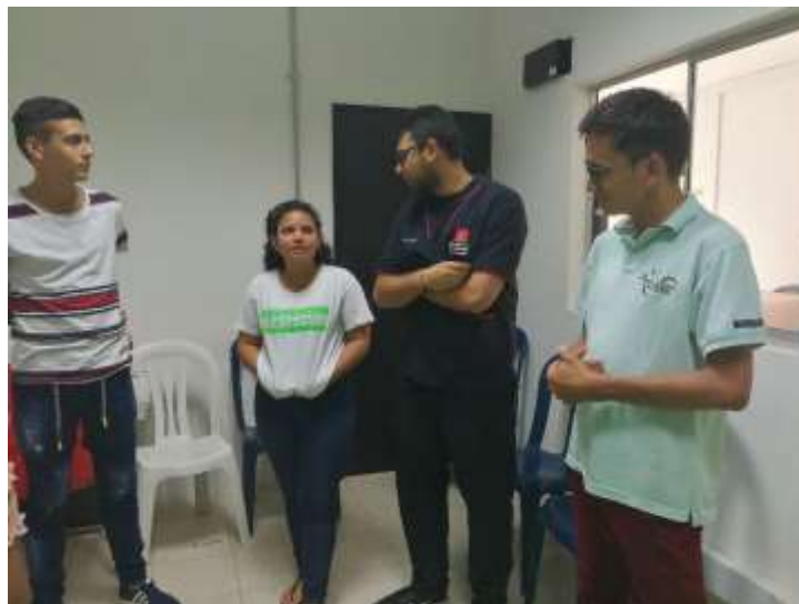
Figura 3. Encuentro con jóvenes de la Corporación Catatumbo Jóvenes Para La Paz y el Desarrollo. Municipio de Tibú, Año 2019

La Corporación Catatumbo Jóvenes Para La Paz Y El Desarrollo Social, es una agrupación de jóvenes que tiene como finalidad el desarrollo del territorio por medio de estrategias culturales y productivas, en las que se vinculan directamente jóvenes del municipio.