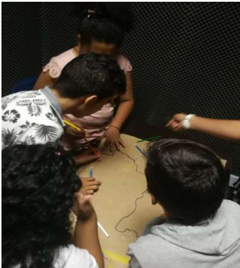
Figura 2. Encuentro con jóvenes de la Corporación Catatumbo Jóvenes Para La Paz y el Desarrollo. Municipio de Tibú, Año 2019.

Son muchos los hechos violentos, victimizantes presentados en un territorio que contiene una gran riqueza social, cultural y natural lo cual pareciera una contradicción, pero también son cientos los hechos de resistencia y proyección social con los que cuenta el municipio de Tibú.