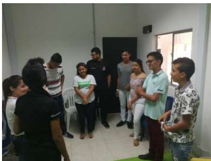
Figura 4. Encuentro con jóvenes de la Corporación Catatumbo Jóvenes Para La Paz y el Desarrollo. Municipio de Tibú, Año 2019

La Corporación Catatumbo Jóvenes Para La Paz Y El Desarrollo Social, es una agrupación de jóvenes que tiene como finalidad el desarrollo del territorio por medio de estrategias culturales y productivas, en las que se vinculan directamente jóvenes del municipio.