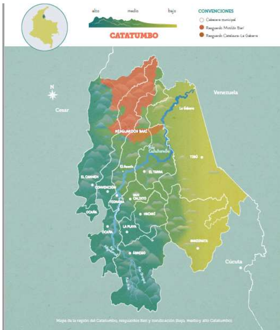
Figura 1. Mapa de la región del Catatumbo, resguardos Barí y zonificación (bajo, medio y alto Catatumbo)

La misma riqueza natural y posición estratégica convierte este municipio en un sector de constante tránsito, establecimiento y disputas entre actores armados y de acciones al margen de la ley. Entre los años 1997 a 2004, particularmente entre mayo de 1999 y diciembre de 2004. Durante este periodo, con el objetivo de controlar a sangre y fuego el territorio y a la población tibuyana, se ejecutaron treinta masacres de cuatro o más personas con un saldo fatal de doscientas sesenta y siete víctimas y diez asesinatos de tres personas cada uno (CNMH, 2015, p 20).