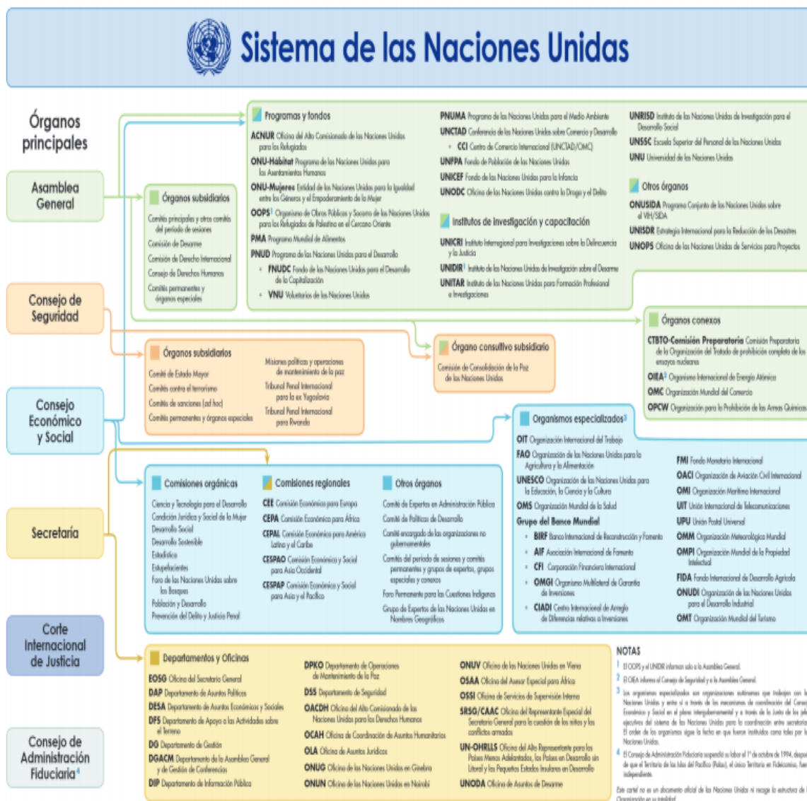
Figura 1. Organigrama de las Naciones Unidas

campo que son manejados por los jefes territoriales. (Alto Comisionado de las Naciones Unidas para los Refugiados, 2016)